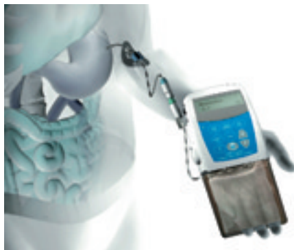
Abb. 1: Kontinuierliche Abgabe einer Levodopa-Carbidopa-Gelsuspension (Duodopa®) mittels einer elektronischen Pumpe über eine PEG-Sonde, deren Spitze im Duodenum liegt.

Rasagilin sollte nicht mit Tolcapon kombiniert werden, das neben der peripheren auch eine zentrale Wirkung hat, die